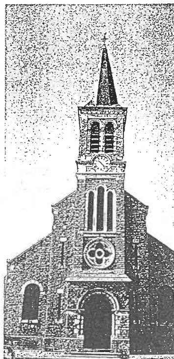
Plaine de la Scarpe et de l'Escaut